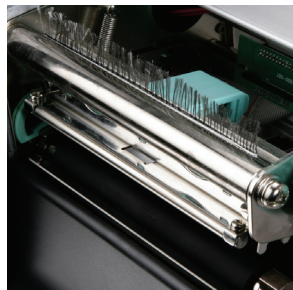
打印模式可支持 热感/热转两用